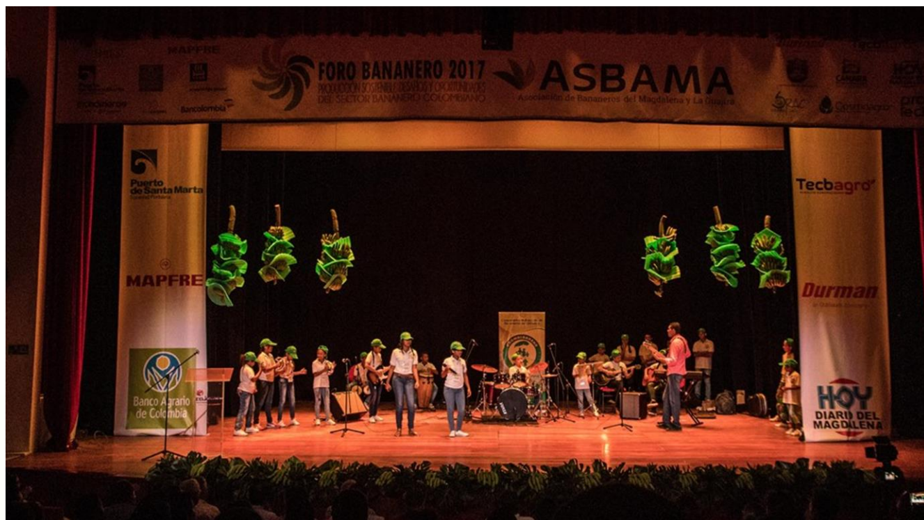
“Momentos de la presentación de los niños de la Escuela de Formación Musical de la Cooperativa Coomulbanano durante la clausura del evento”.

El cierre del evento estuvo a cargo de 25 niños de la Escuela de Formación Musical de la Cooperativa de Pequeños Productores de Orihueca – Coomulbanano, quienes emocionaron a los asistentes con su presentación, resaltando el proceso de formación que adelantan con recursos recibidos de la prima de Mercado Justo - Fairtrade International (FLO). A través de la participación de la Escuela de Música, la Asociación destacó la importante labor desarrollada por la cooperativa en el ámbito cultural, exaltando la identidad e idiosincrasia de los productores del Municipio Zona Bananera.